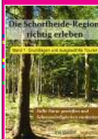
Wandlitz: Ino Weber