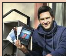
Dokumentarfilmer bringt Ost und West zusammen S. 14-15