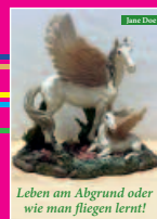
Bernau: Jane Doe