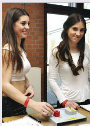
■ Die früheren Werkräume laden zu Physik und Technik ein. Wie man sieht, können sich auch die Mädchen dafür begeistern.