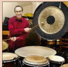
Das Geheimnis von Frank Zappa S. 18-19