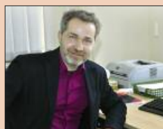
Neuer Elan mit neuem Bürgermeister S. 6-8