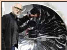
Schule macht Kohle! S. 10-12