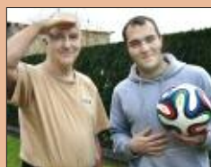
Neues Fußball-Fieber in Buch! S. 18-19