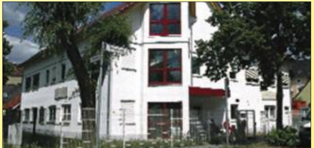
■ Das Alwall-Haus ist für jeden bequem erreichbar.

Alwall-Haus Dialyse-Zentrum Berlin Viereckweg 1-3 • 13125 Berlin Tel. 030/94 108 10 Fax 030/94 10 82 22 www.alwall-dialyse.de