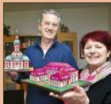
Theodor Fontane und die geheimnisvolle Gräfin! S. 14-15